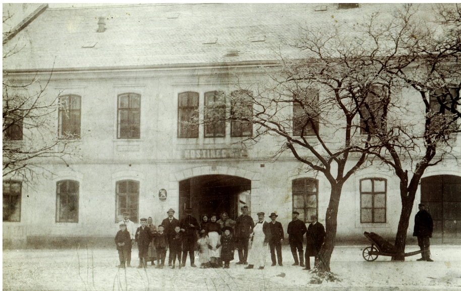
Hostinec čp. 20 kolem roku 1900. Dnes stojí na jeho místě nákupní středisko.