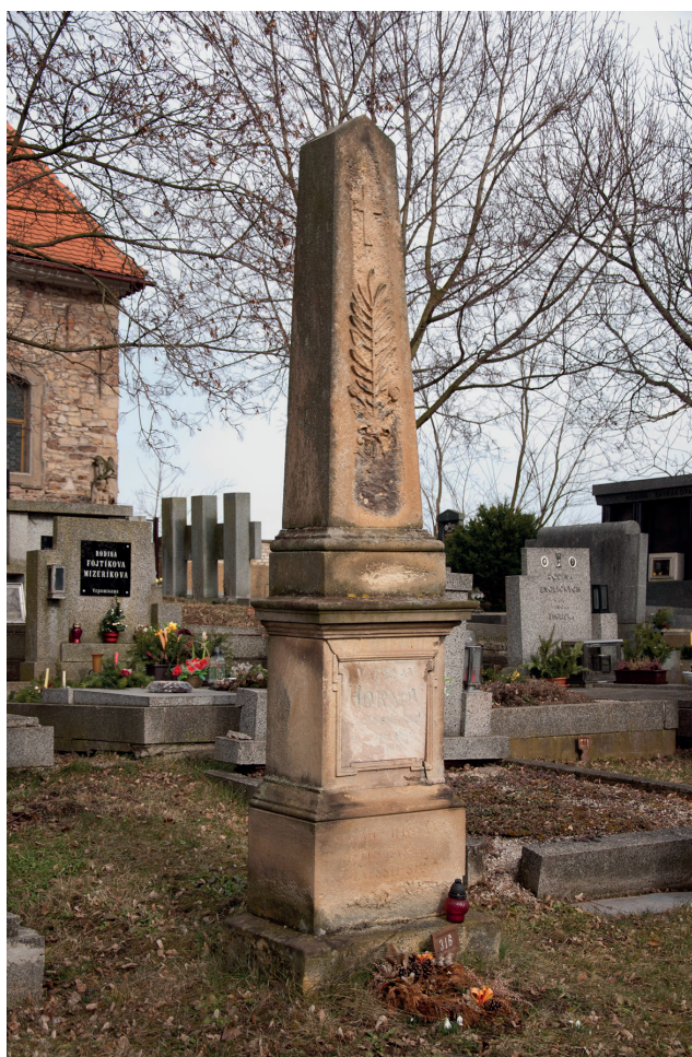
Hrob Václava Hornofa na kněževském hřbitově