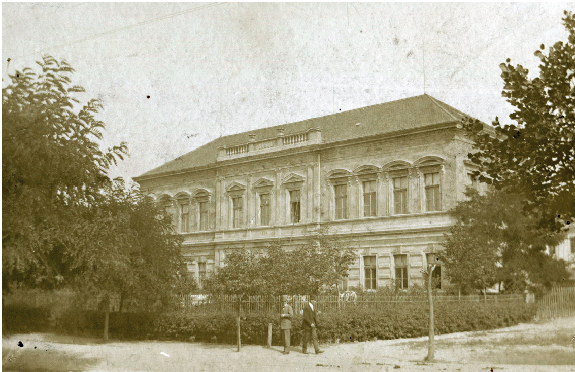
Budova obecné školy dokončená v roce 1884