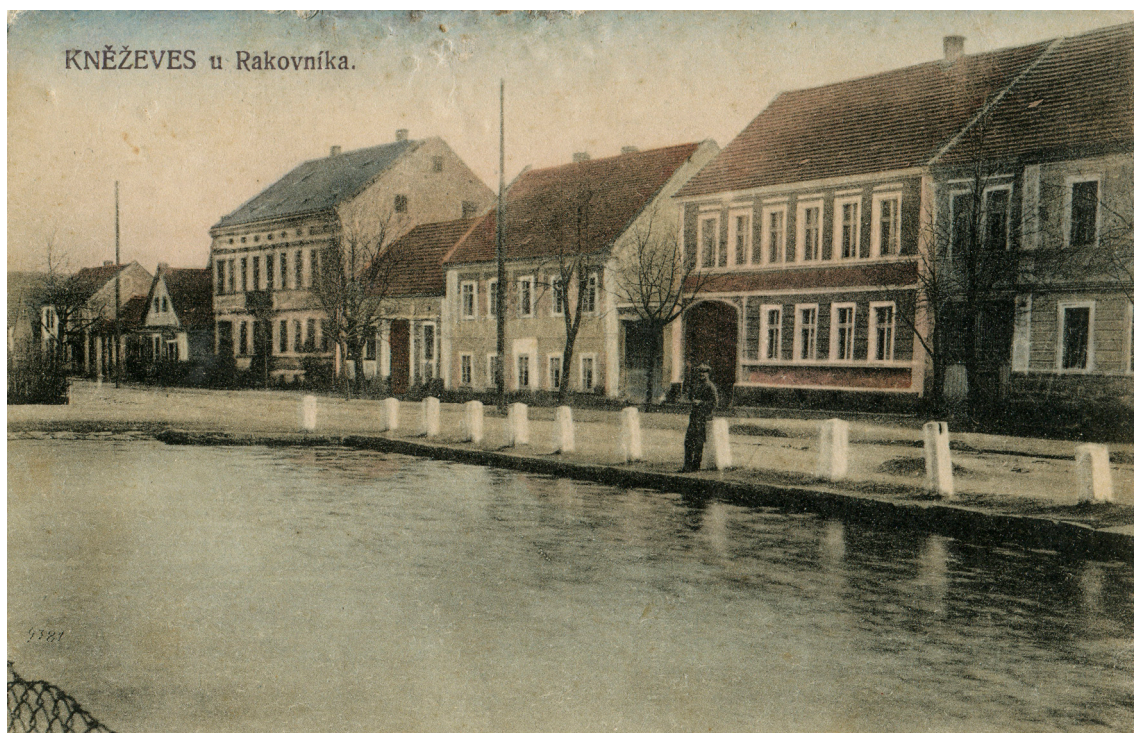
Jižní strana náměstí s domem Jakuba Štrose (patrový dům vlevo)

bezzemek, jedni na zdaru chmele hospodářsky rostli, jiní v případě nezdaru hynuli, vždyť těmto často peněžní ústavy nebo věřitelé soukromníci statky ve dražbách prodávali. Jiní je za babku kupovali.