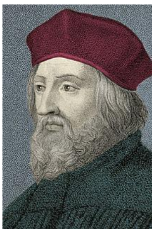
Jan Hus 1370 (1371) – 6.7.1415

6. července si připomeneme 600té výročí smrti Jana Husa, náboženského myslitele, kazatele, reformátora, učitele, kněze. Je označován za jednoho z nejvýznamnějších Čechů.